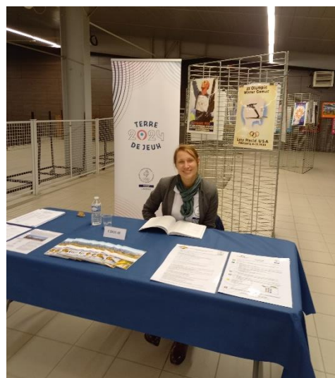
Le CDOS présent au Salon du Livre de Mende

Le 19/11, le CDOS a aussi mis à disposition son exposition sur les affiches des « Jeux Olympiques Hiver » pour le Salon du Livre de Mende dont la thématique était « Le Temps ».