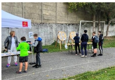
Ateliers Sportifs et Ateliers Quizz au Cross Solidaire du Collège Bourillon