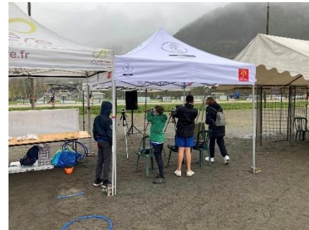
Ateliers Sportifs au Championnat départemental UNSS de Cross-Country